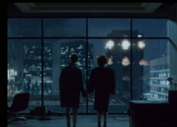
Fotograma El club de la lucha