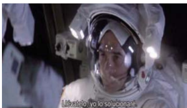
Llévate, yo lo solucionaré.

“Ikon es una reliquia de la guerra fría. Lleva flotando en el espacio desde que cayó la Unión Soviética. Lleva seis misiles a bordo dirigidos a bases estratégicas americanas. Todas, y eso es lo peor, en áreas metropolitanas. Si Ikon deja de comunicar supondrá que ha habido una catástrofe e iniciará el lanzamiento”.