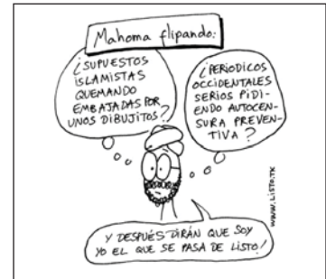
9 JALIFE RAHME Alfredo: "Detrás de las 12 malditas caricaturas danesas", La Jornada , 8 de febrero de 2006. Disponible en http://www.jornada.unam.mx/2006/02/08/024o1pol.php

—por otra parte, que pueden construirse temas distintos si relacionan el mismo acontecer con el mismo principio, pero encadenando ese acontecer a un repertorio diferente y es éste repertorio el que se interpreta o evalúa con arreglo al referido principio. Por ejemplo, la ambición de poder y el uso del terror para alcanzarlo por parte de los islamistas.