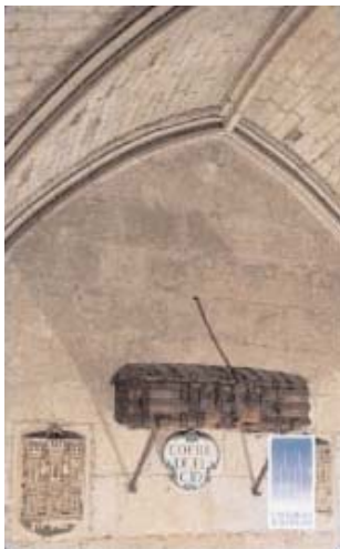
5 MENÉNDEZ PIDAL, 1938: Flor Nueva de Romances viejos . Austral, Madrid, 2006, p.171.

Que se ha convertido en símbolo del valor mismo de la palabra del Cid, cosa que cristalizará en un romance posterior, recogido por Juan de Escobar en su Historia y romancero del Cid , publicado en Lisboa, en 1605.